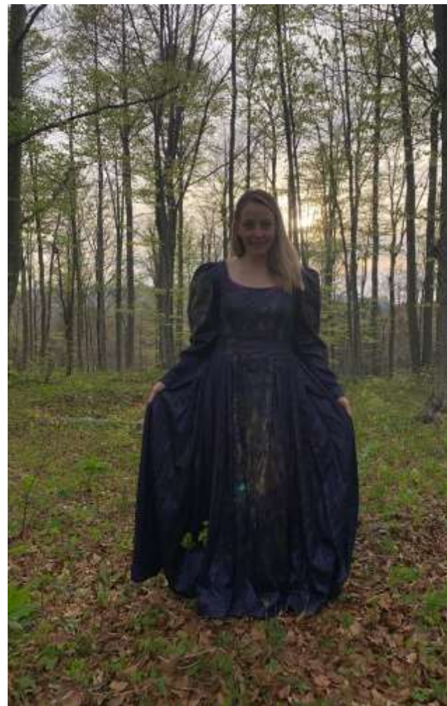
Slika 2: Oblačilna kultura na dvorih: stilizirani odtenki oblek v več različnih fazah.