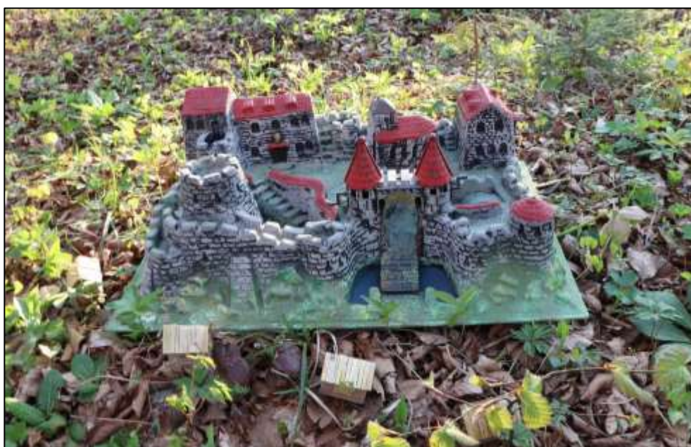
Slika 1: Udeleženci spoznavajo srednjeveško življenje in gradove s pomočjo makete.